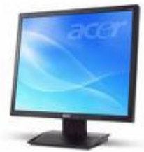
Monitor 19" V193bdm 0.294 1280x1024, 5ms, 2000:1